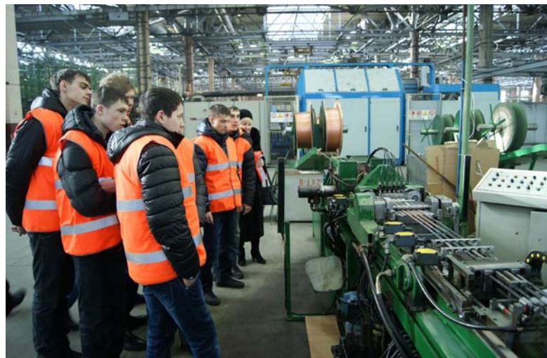
Студенты Волжского филиала «ПГТУ» местом практики в этом году, скорее всего, выберут завод «Совиталпродмаш».

Все больший интерес к заводу «Совиталпродмаш» проявляют городские учебные заведения.