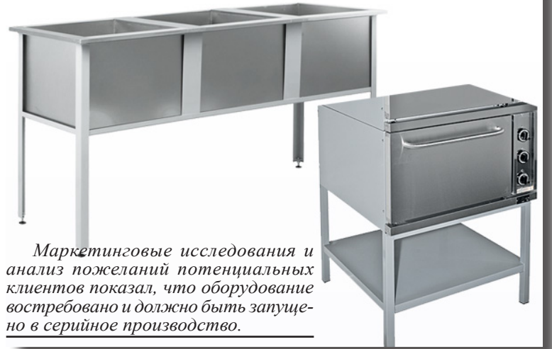
Маркетинговые исследования и анализ пожеланий потенциальных клиентов показал, что оборудование востребовано и должно быть запущено в серийное производство.

Этой весной ассортимент профессионального оборудования торговой марки RADA для предприятий торговли и HoReCa пополнился качественной и надежной в эксплуатации техникой – жарочным шкафом и новыми моечными ваннами.