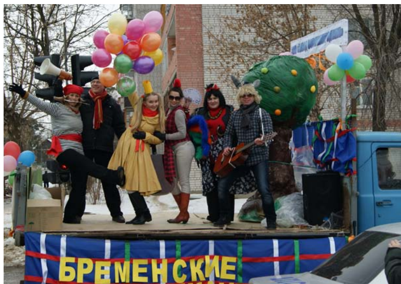
Бременские музыканты пели, танцевали, раздавали блины и дарили улыбки, шарики и отличное настроение.