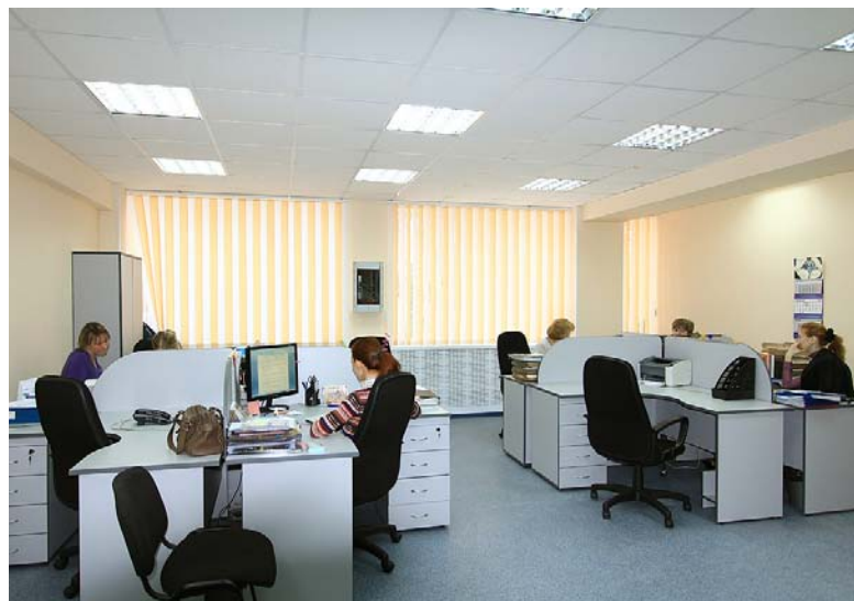
Помещение отдела по работе с персоналом приняло вид офиса в формате open space. Это не только повысит рабочие показатели, но и усилит командный дух между сотрудниками отдела.

Так же здесь появились оборудованные по всем стандартам комнаты приема будущих сотрудников ЗАО «Завод Совиталпрод-