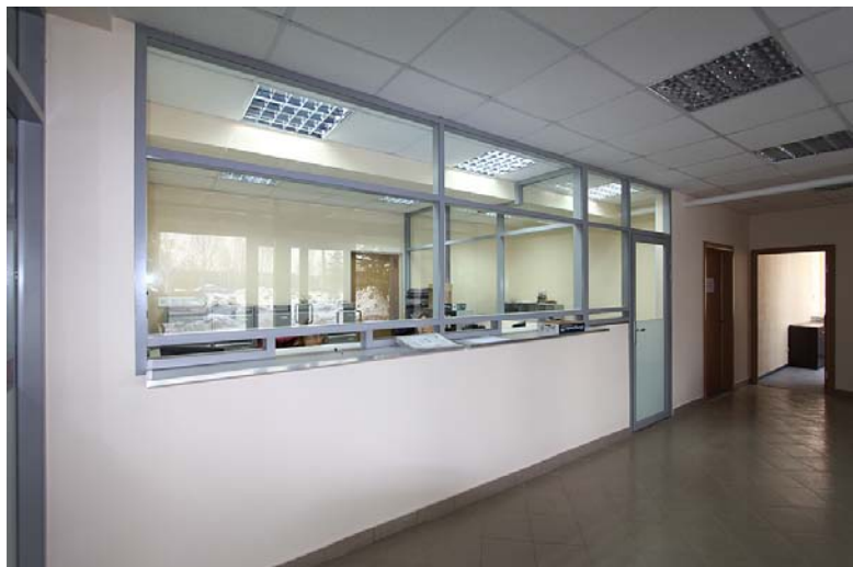
Комнаты приема персонала приняли современный вид. Теперь общение между сотрудниками отдела по работе с персоналом и посетителями стало еще удобнее.

Завод «Совиталпродмаш» постоянно преобразуется, и это видно невооруженным взглядом. Одной из самых заметных «переделок» за последнее время стал ремонт помещения отдела по работе с персоналом.