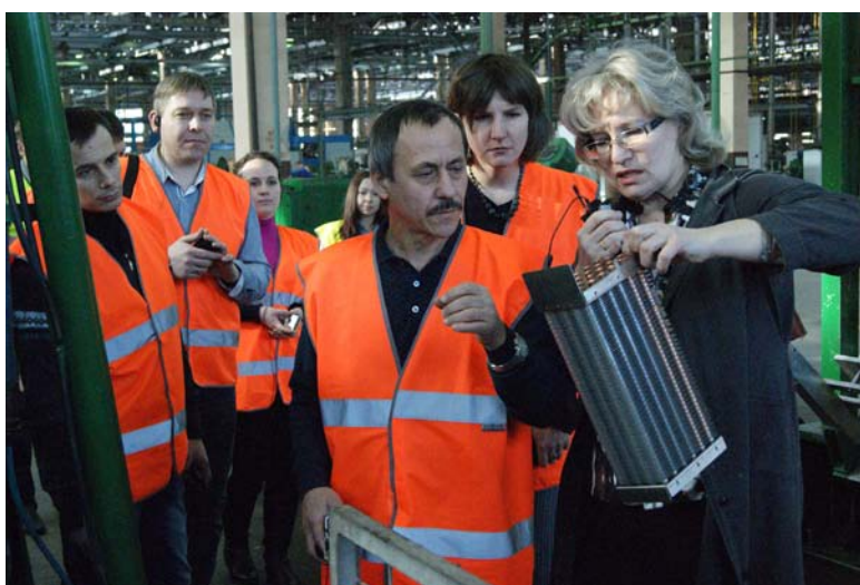
Делегация компании «Балтика» ознакомилась практически со всеми производственными процессами завода «Совиталпродмаш».

«Балтийцы» появились на «Совиталпродмаше» не в первый раз. Прежде эти две организации уже связывали деловые отношения. Нынешний визит был направлен на их продолжение.