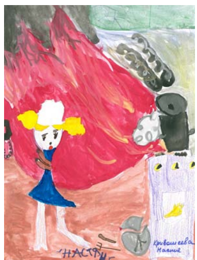
Настя Кривошеева 4 года

Все работники завода знают, что их дети могут бесплатно поехать на отдых в загородные лагеря. Нужно только заранее подать заявление в отдел по работе с персоналом. Этим летом счастливыми обладателями путевок на три смены в лагерь «Каменная речка», «Таир», «Электрон», «Шан» стали два десятка детей.