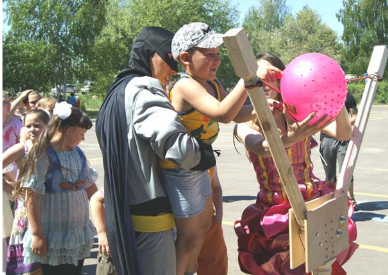
Оказывается, Бэтмен, Фея и Angry Birds – неотъемлемые составляющие успешного детского веселья.

«Совиталпродмаш», детки участвовали в веселых командных конкурсах, боксировали огромными мягкими перчатками, сбивали «свинок» в игре Angry Birds, рисовали мелками на асфальте, а ведущими веселья были Бэтмен и Фея. Кроме того, каждый малыш смог полакомиться сахарной ватой, фруктами и соком, а также получить множество подарков. Одним словом, лето для детей наших сотрудников не только началось, но и прошло под знаком «Совиталпродмаша», а это значит разнообразно, интересно и очень вкусно.