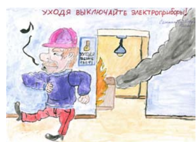
София Санникова 10 лет