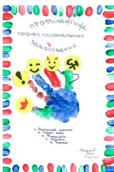
Алан Джафаров 1 год