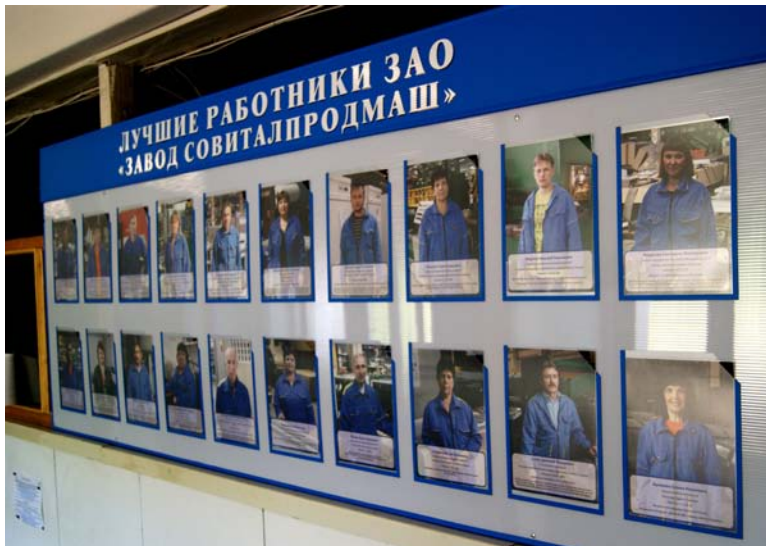
Так выглядит Доска почета корпуса № 6.

Казалось бы, о временах советского прошлого остались лишь воспоминания, но как показывает практика, некоторые реликты того периода находят себе достойное применение и в современном обществе. Пример тому - Доска почета.